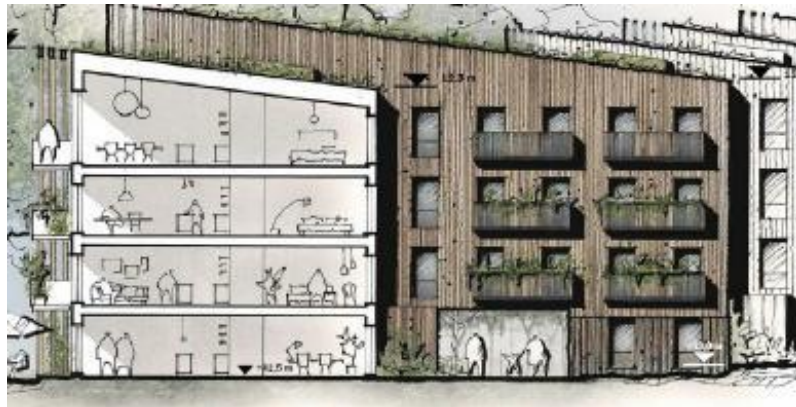
Cykelställ hela fasaden