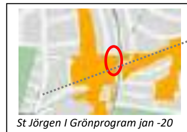
St Jörgen i Grönprogram jan -20

Att "Länsstyrelsen delar kommunens bedömning om att planen inte innebär betydande miljöpåverkan". Är en dubiös sammanfattning av ett långt ifrågasättande remissvar. Det är inte möjligt att länsstyrelsen kan bortse från de beslut som finns nationellt, regionalt och kommunalt. Planeringsprinciper i regionplan 22: "Skapa förutsättningar för välfungerande ekosystem, kvantitativt och kvalitativt ... Kommunernas grönprogram är bra verktyg ..."