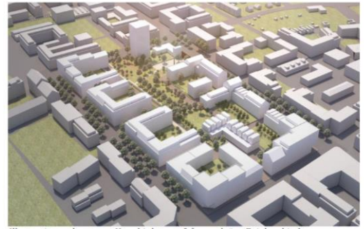
Illustration av kvarteret Kugghjulet sett från nordväst. Fojab arkitekter.